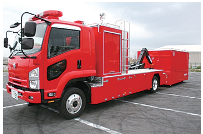
大型除染システム搭載車