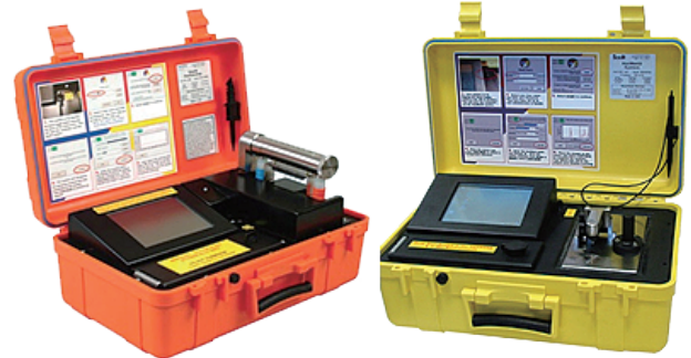
特殊災害対応自動車の積載資機材 (可搬型化学剤検知・同定装置)