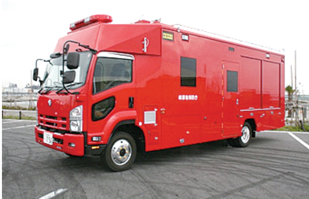
特殊災害対応自動車

さらに、広島土砂災害や御嶽山噴火災害を踏まえ、重機 *7 及び重機搬送車並びに火山対応型山岳救助資機材キット *8 、有毒ガス（化学剤）検知器を配備し、