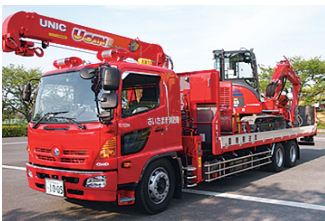
重機及び重機搬送車