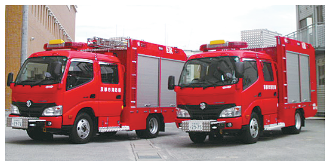
大規模震災用高度救助車